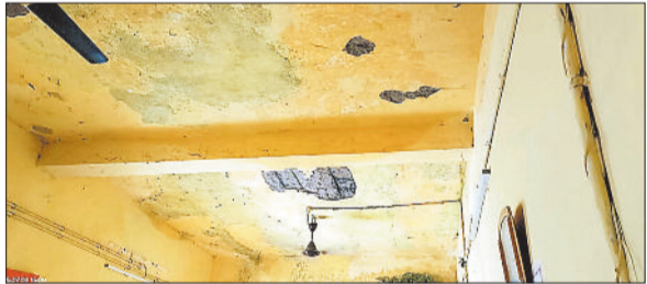
भवन के छत का उखड़ा प्लास्टर।

पुलिस थाना बिर्वा का भवन जर्जर हो चुका है। जगह जगह से छत का प्लास्टर उखड़कर गिर रहा है। वहीं दीवारों में सीलन आ गई है।