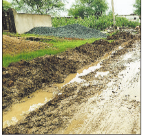
तुस्मा खैरताल की जर्जर सड़क।

इस मार्ग का उपयोग रोजाना सैकड़ों ग्रामीण करते हैं, जो कृषि, शिक्षा, स्वास्थ्य और व्यापार के लिए खैरताल और आसपास के क्षेत्रों में आते-जाते हैं। लेकिन सड़क की जर्जर स्थिति के कारण न केवल लोगों का आवागमन बाधित हो रहा है, बल्कि दुर्घटनाओं का खतरा भी लगातार बना हुआ है। ग्रामवासियों का कहना है कि इस मार्ग की मरम्मत और निर्माण को लेकर कई बार जिला प्रशासन और संबंधित विभाग को पत्राचार किया गया है।